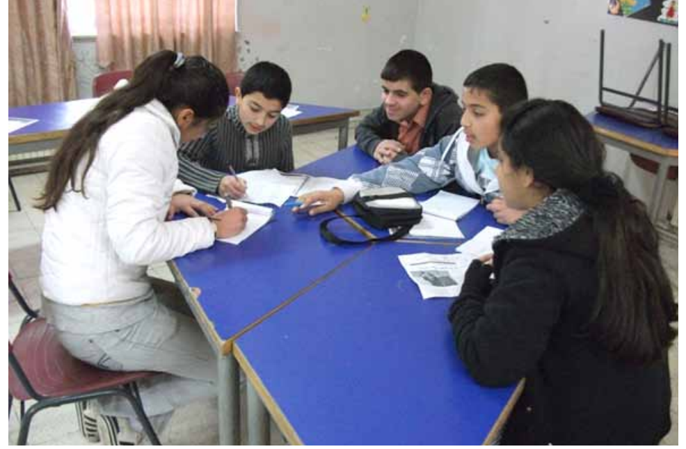
أطفال الإعلام البيئي يسجلون ملاحظاتهم ويغذون مدوناتهم بأخبار البيئة.

شؤون البيئة وهمومها من مساحاتها وفضائها المتعددة بشكل كبير. ويتابع: لو تعامل الإعلاميون في فلسطين مع البيئة على أنها «كلمات متقاطعة» أو «أبراج حظ» لتغير وعينا بقضايا خطيرة نعيشها كل يوم.