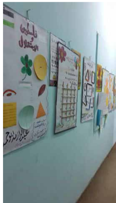
من أعمال الأطفال في الدار.