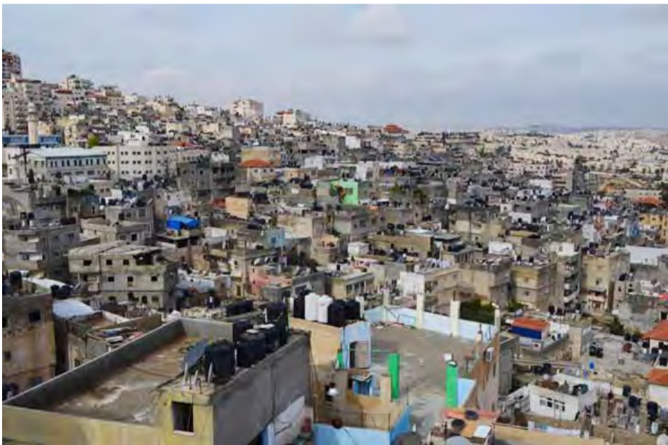
ضغط عمري وسكاني في المخيم، ولا حلول في الأفق.

وأشار إلى مشكلة النفايات المترامية التي تقدر بـ ٢٠ طن يومياً، تزيل وكالة الغوث منها ١٦ طناً فقط، وبقيتها تظل على الأرصفة والطرق، مسببة أمراضاً جلدية ومشوهة المنظر العام.