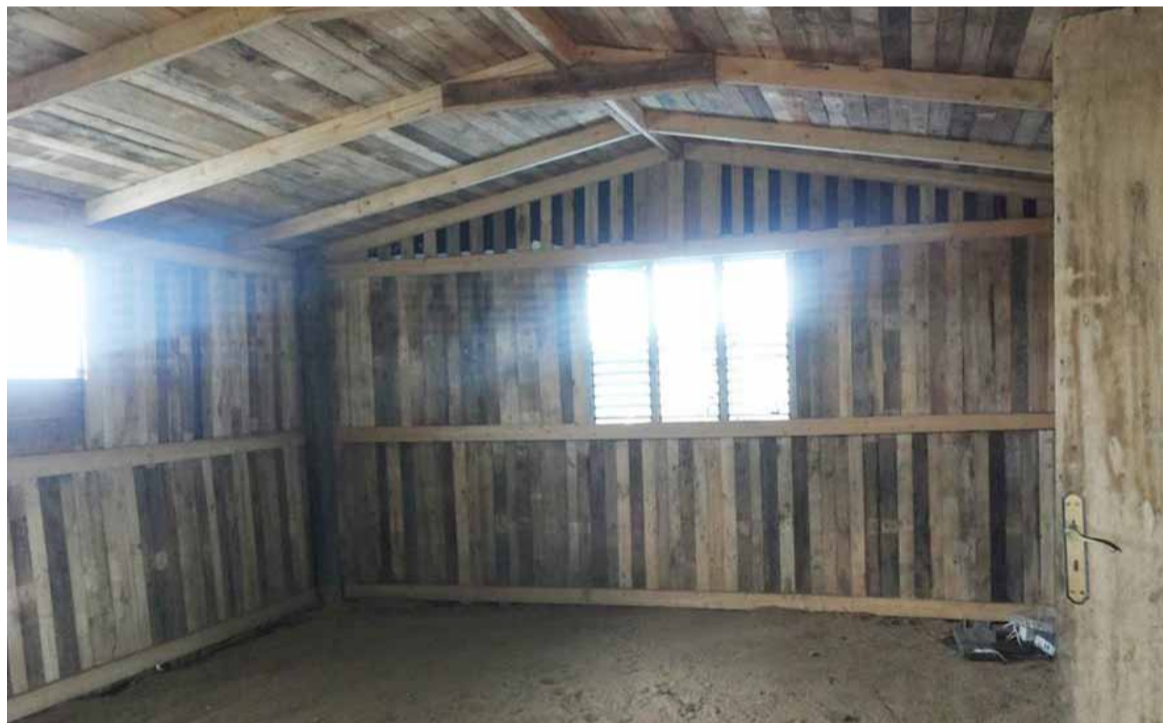
البيت الخشبي من الداخل.