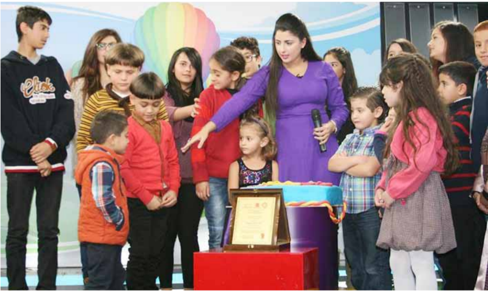
مشهد من البرنامج.

نفسها وتطوير البرنامج، وأشارت أيضاً إلى أنها تتعامل مع الطفل كشخص مثلها كي تمكن الطفل من إخراج مواهبه وقدراته وهنا تكون قد أنجزت خطتها السرية في إبراز مهارات الأطفال.