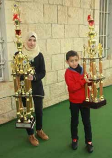
أطفال فلسطين يحصدون الذهب في مسابقة دولية.